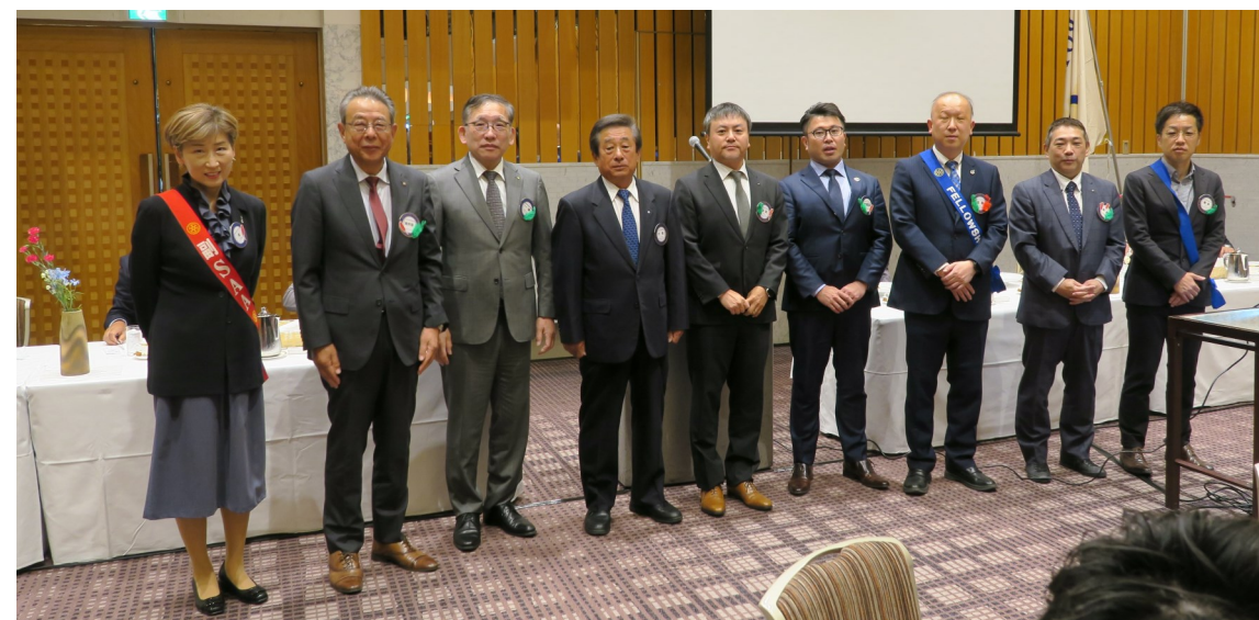
シンガポール国際大会結団式風景

WEEKLY BULLETIN:ROTARY CLUB OF KYOTO-FUSHIMI RID-2650