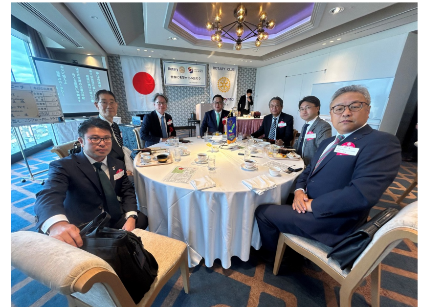
5月9日 京都モーニングRC例会にて…

WEEKLY BULLETIN:ROTARY CLUB OF KYOTO-FUSHIMI RID-2650