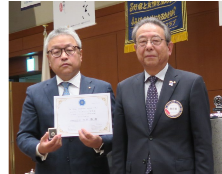
大田会長へのエレクトRLI修了証