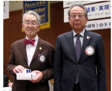
弓削会員 R財団メジャードナー表彰