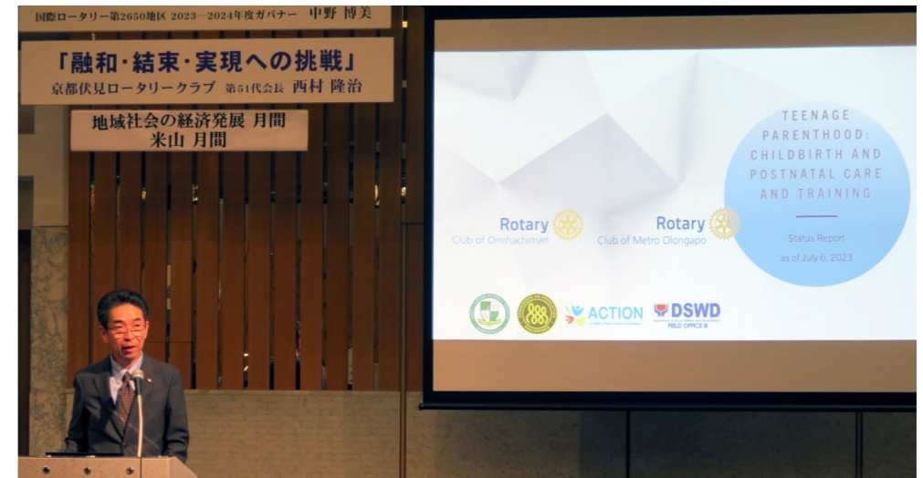
前回例会スピーチの一場面

WEEKLY BULLETIN:ROTARY CLUB OF KYOTO-FUSHIMI RID-2650