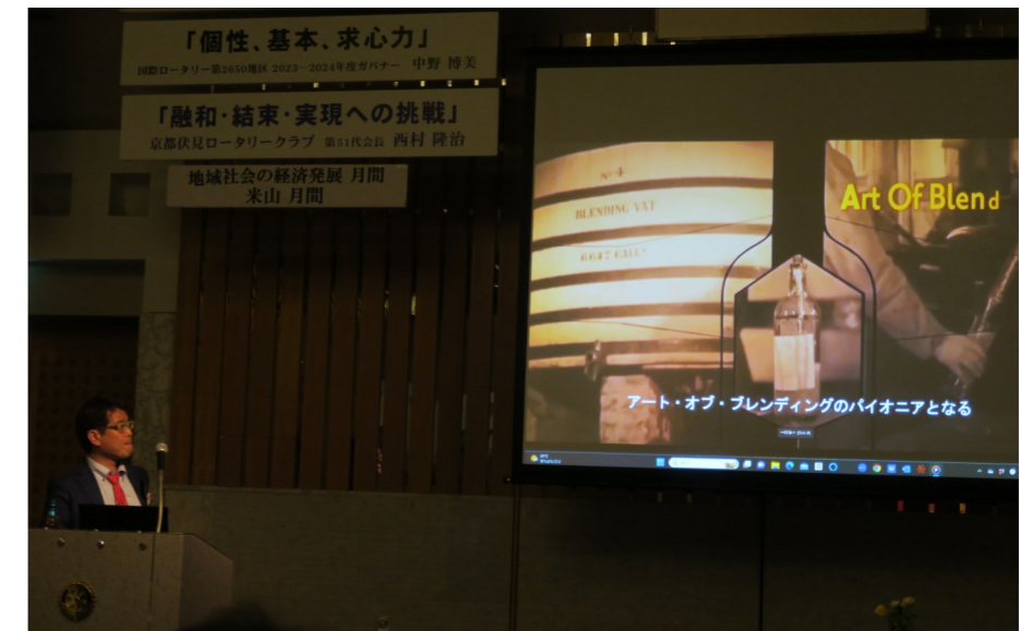
前回例会スピーチ風景

WEEKLY BULLETIN:ROTARY CLUB OF KYOTO-FUSHIMI RID-2650