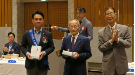
徳本会員、松原会員お誕生日おめでとうございます