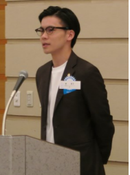
京都伏見RAC会長 挨拶風景