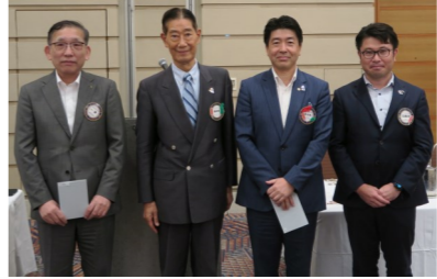
米山功労者(マルチプル)表彰風景