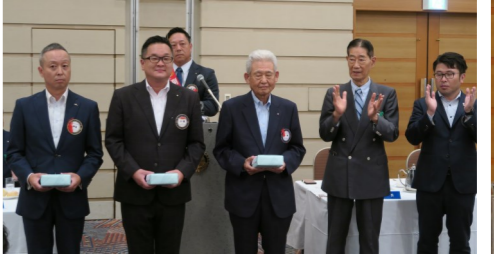
中見会員、小畑会員、柳本会員 お誕生日おめでとうございます