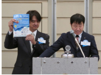
宇治鳳凰RCから IMのPRに 来られました