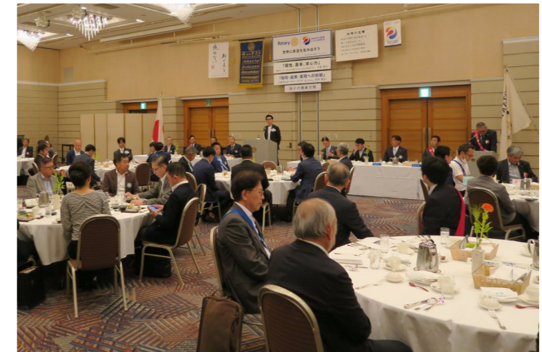
前回例会の一場面から…

WEEKLY BULLETIN:ROTARY CLUB OF KYOTO-FUSHIMI RID-2650