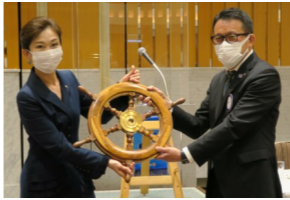
次年度会長へ舵輪引継ぎ