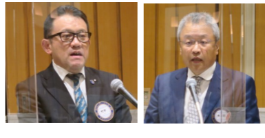
会長・幹事退任挨拶風景