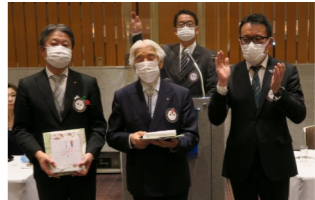
お誕生日お祝い風景