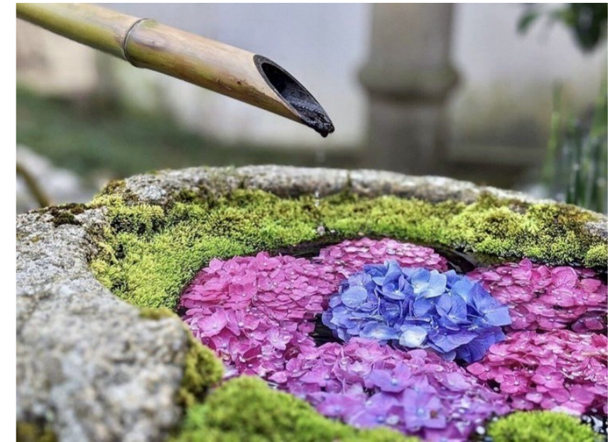
「紫陽花」 撮影：本田顕哲 委員

WEEKLY BULLETIN:ROTARY CLUB OF KYOTO-FUSHIMI RID-2650