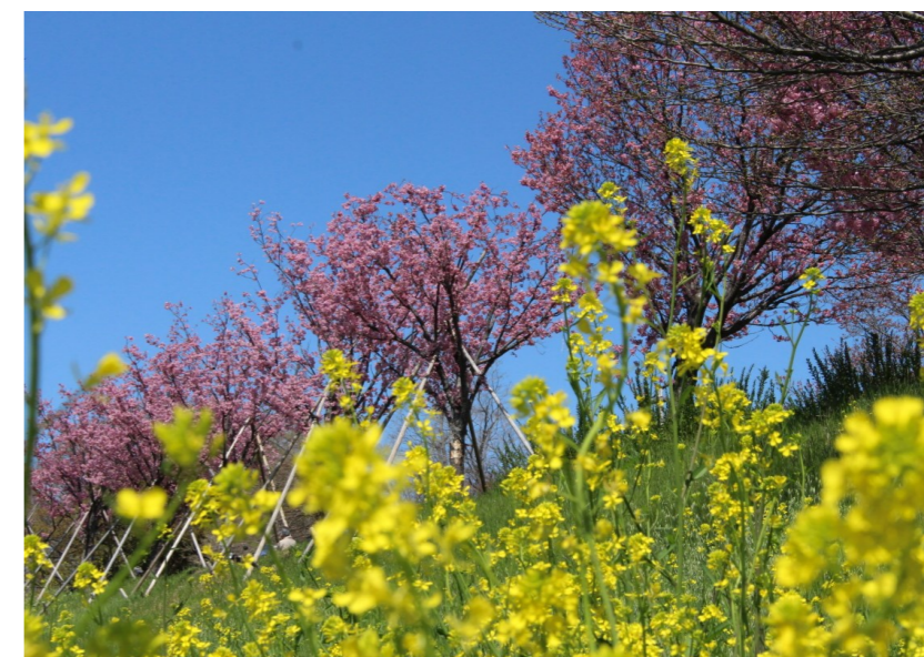
「菜の花と桜」 於：吉祥院桂川・天神川合流付近

WEEKLY BULLETIN:ROTARY CLUB OF KYOTO-FUSHIMI RID-2650