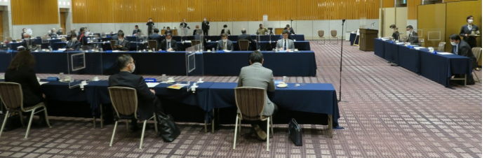
前期クラブ・アッセンブリー風景