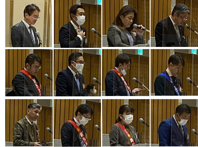
情報集会まとめ報告～ 各班班長からの発表風景～