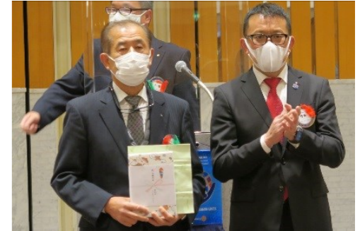
山口会員 お誕生日おめでとうございます