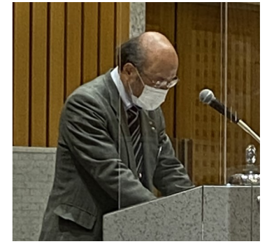
次年度理事本選挙結果発表