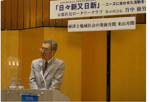
馬場ガバナーのガバナー公式訪問所感