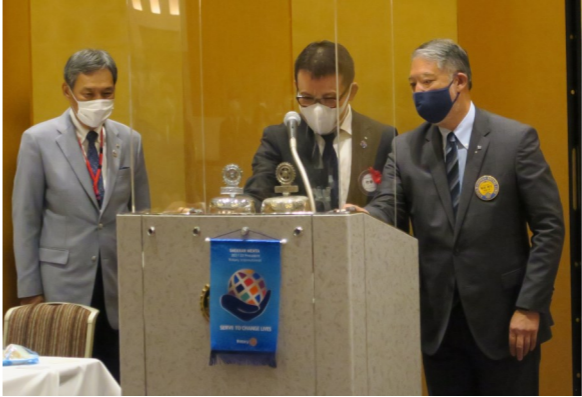
合同例会点鐘風景