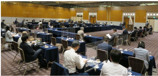
クラブ・アッセンブリー風景