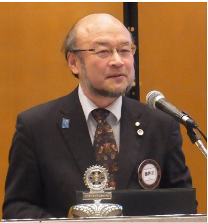
藤井(正)会長エレクト方針発表