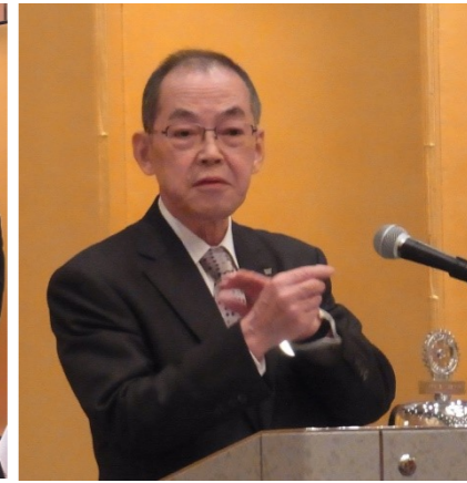
高崎会員のスピーチ風景