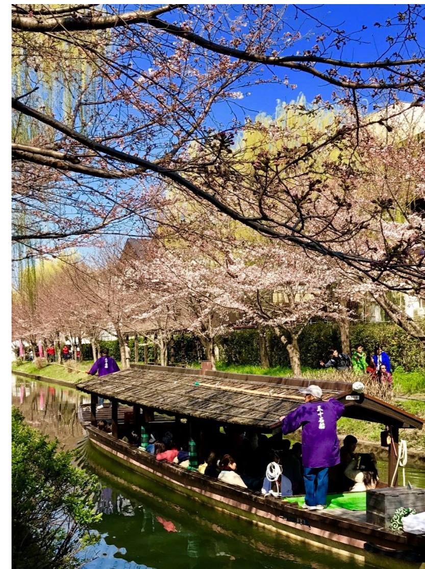
「三十石船」