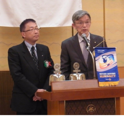
京都洛南・京都伏見両会長による点鐘