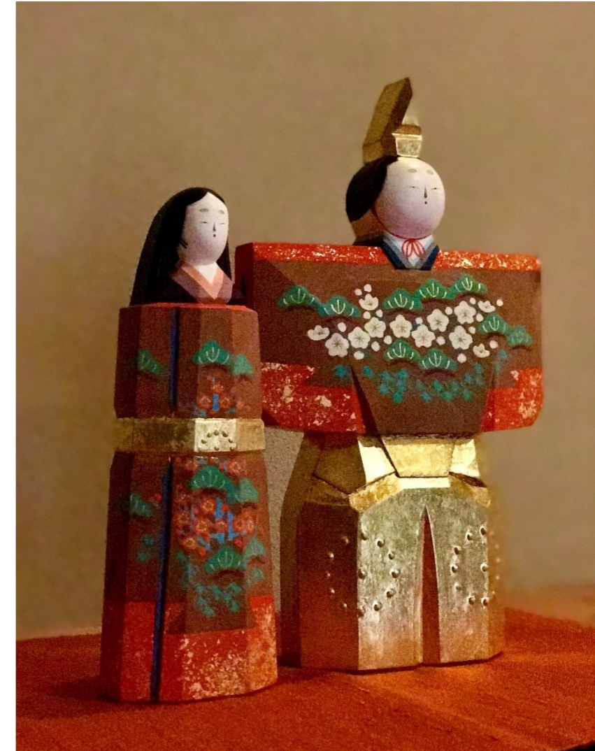
「一刀彫 立雛」