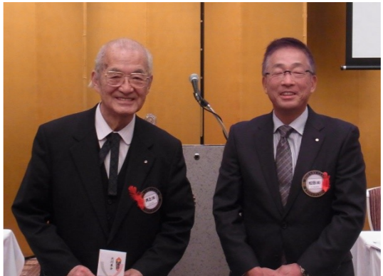
赤い羽根共同募金贈呈風景