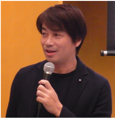
ゲストスピーカー スポーツジャーナリスト 中西 哲生 様