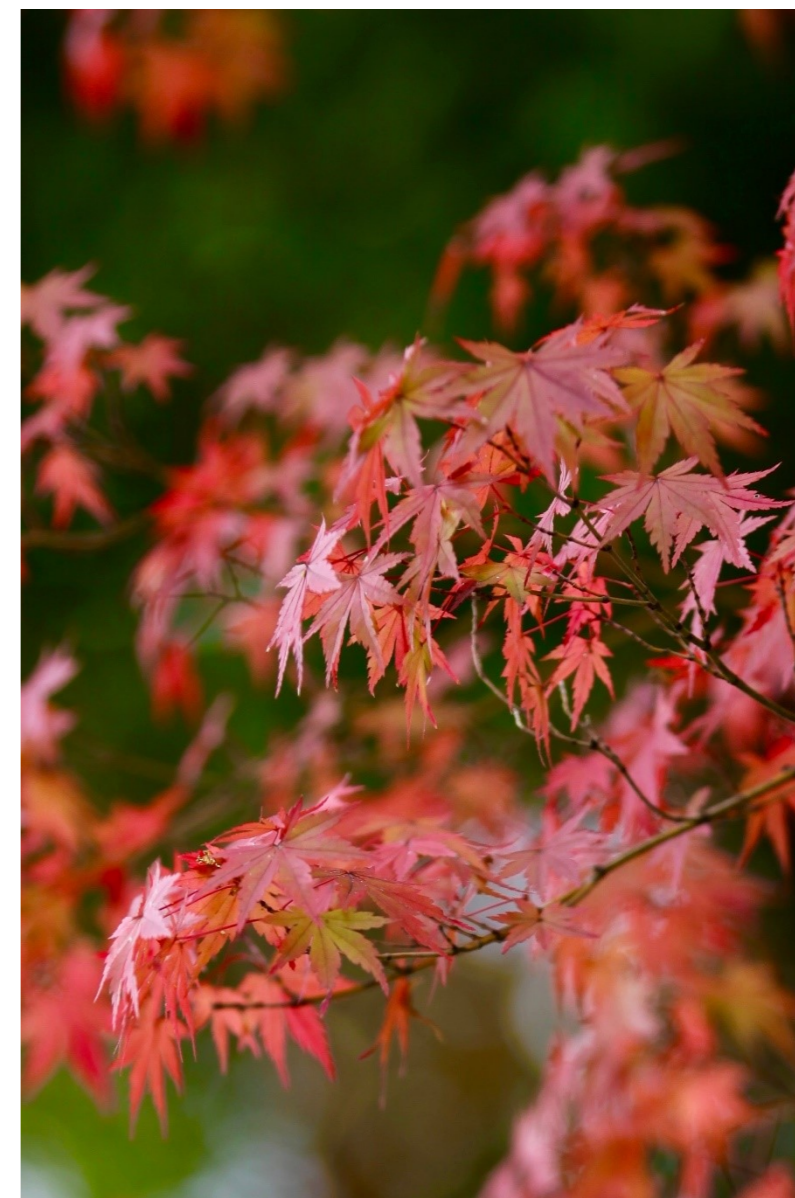
「紅葉」於)智積院

WEEKLY BULLETIN:ROTARY CLUB OF KYOTO-FUSHIMI RID-2650