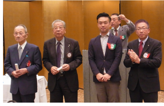
松原会員、野村会員、徳本会員お誕生日おめでとうございます