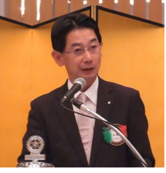
人見会長次々年度会長選出