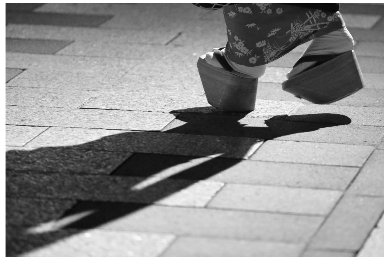
「おかえりやす」 於：宮川町歌舞練場前

WEEKLY BULLETIN:ROTARY CLUB OF KYOTO-FUSHIMI RID-2650