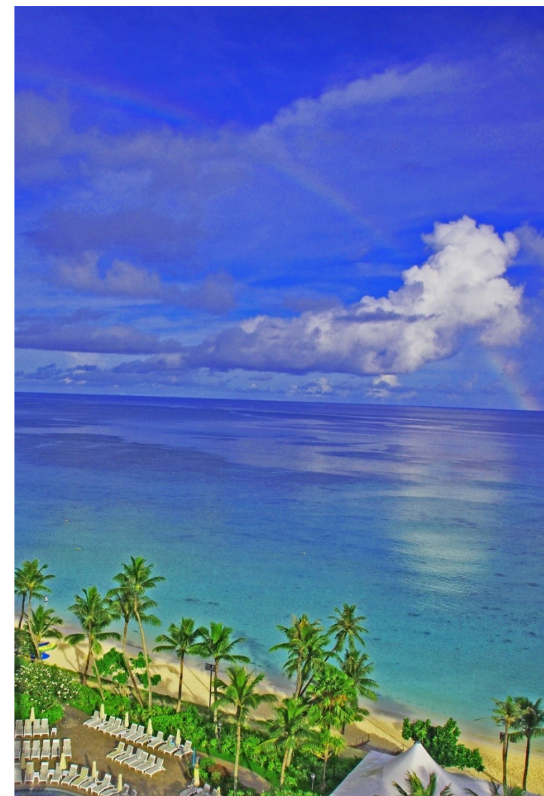
「虹の架け橋」於) グアム島