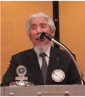
杭迫会員お誕生日 おめでとうございます