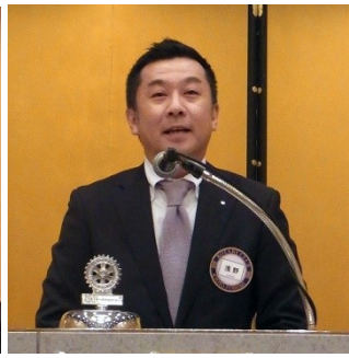
浅野15-16年度幹事 退任挨拶