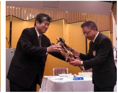
前年度から本年度への舵輪引継ぎ