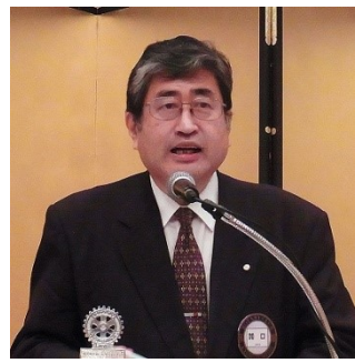
加口15-16年度会長 退任挨拶