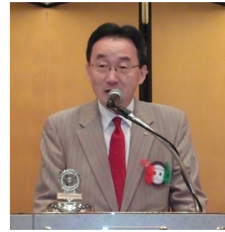
森本会員退任挨拶