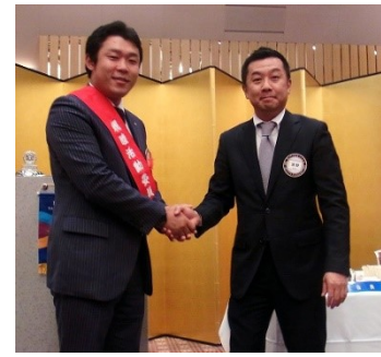
前年度から本年度への幹事バッジ引継ぎ