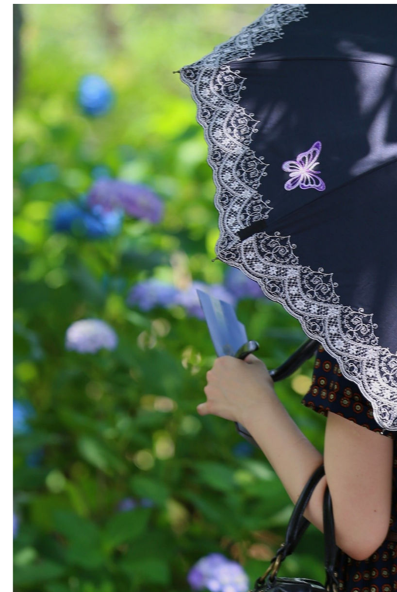
「蝶と紫陽花」於)天龍寺

WEEKLY BULLETIN:ROTARY CLUB OF KYOTO-FUSHIMI RID-2650