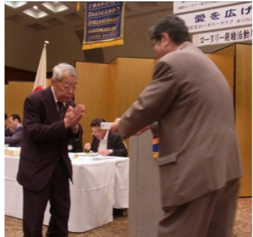
岸会員 お誕生日おめでとうございます