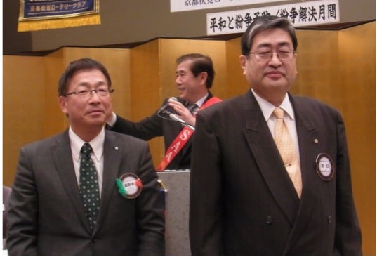
松田会員 お誕生日おめでとうございます