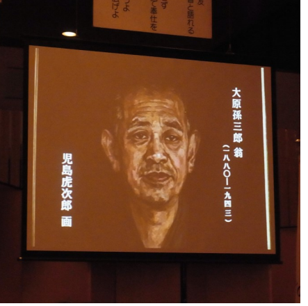
櫻木会員スピーチのDVD映像