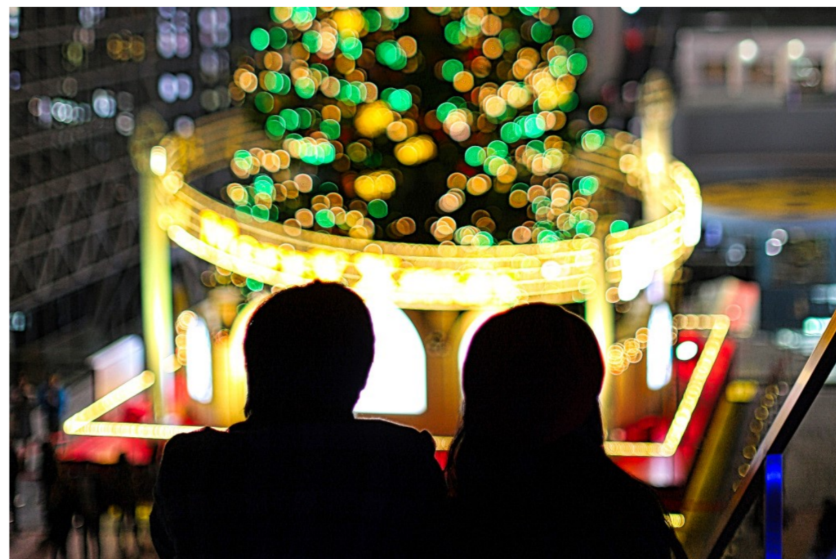
「ふたりのMerry Christmas」 於)京都市駅前大階段

WEEKLY BULLETIN:ROTARY CLUB OF KYOTO-FUSHIMI RID-2650