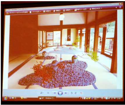
笹岡 隆甫 様の作品写真